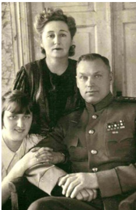
К.К. Рокоссовский с женой и дочерью. 1943 год

– Войну дед встретил в должности командира 9-го механизированного корпуса. 22 июня дежурный офицер принес ему телефонограмму из штаба 5-й армии: вскрыть особо секретный оперативный пакет. Однако сделать это можно было только по распоряжению председателя Совнаркома СССР или народного комиссара обороны. А связь уже была немцами