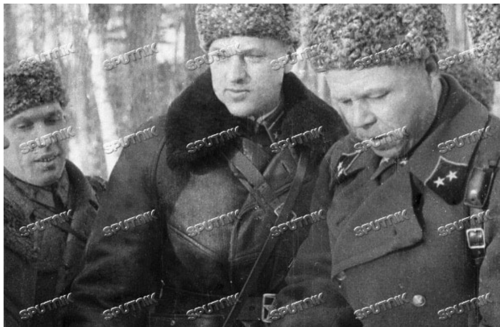
Генерал-лейтенант К.К. Рокоссовский (в центре) с офицерами на командном пункте 16-й армии. Декабрь 1941 года

– Сталин был для деда прежде всего начальником, и начальником хорошим. Между ними было взаимное уважение. Дед на похоронах Сталина плакал, и, как мне кажется, не от излишней сентиментальности. Я думаю, просто он понимал, кто