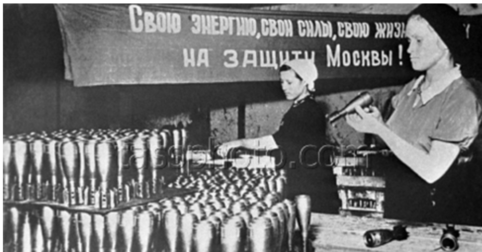
Наступление Красной армии было бы невозможно без поддержки тыла. Производство мин на одном из московских оборонных заводов

левая сильное течение реки, уносившей отдельные звенья настила, навели переправу. По ней на западный берег пошли главные силы дивизии.