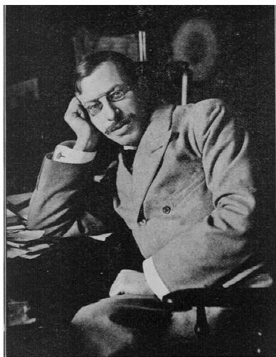
Cliche de Elliot and Fry, London.

поговорим, 24 ноября 1895 г. писал в лондонской “Pall Mall Gazette”: «Вопреки противоположным утверждениям я заявляю, что евреи