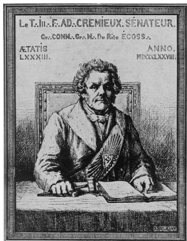
ITZKAK AARON MOÏSE (dit ADOLPHE) CRÉMIEUX revêtu des insignes du 33° degré de la F. M.

«Он был бесконечно предан либеральной партии», и в то же время... «он исповедовал иудейскую веру и всю свою жизнь свидетельствовал свою неустанную преданность своим единоверцам», – читаем мы о нем во французской «Большой энциклопедии».