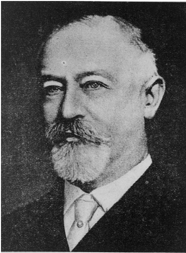
JACOB H. SCHIFF à l'époque de la guerre mondiale.

“Позвольте мне в качестве непримиримого врага тиранического самодержавия, безжалостно преследовавшего моих единоверцев, поздравить с вашей помощью русский народ с деянием, которое он столь блестяще осуществил только что, и пожелать вашим товарищам по правительству и вам лично полного успеха в великом деле, за которое вы взялись с таким патриотизмом. Да благословит вас Бог!”