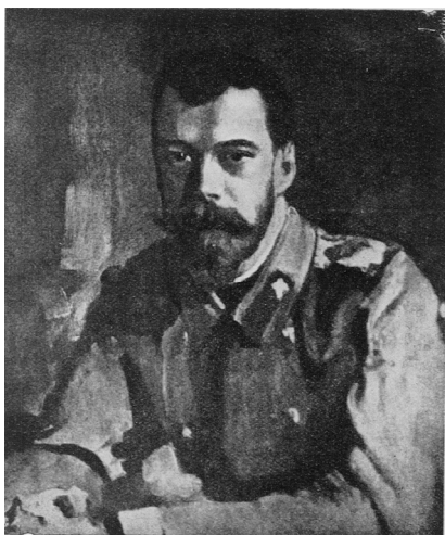
SA MAJESTÉ L'EMPEREUR NICOLAS II

В феврале 1917 г. находившаяся под моим командованием 19-я пехотная дивизия стояла перед г. Станислав